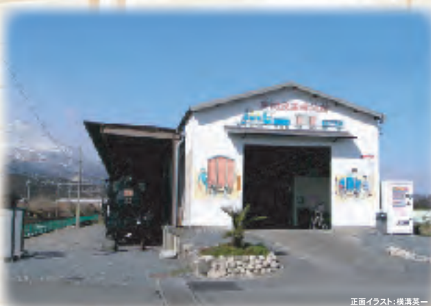
正面イラスト:横溝英一