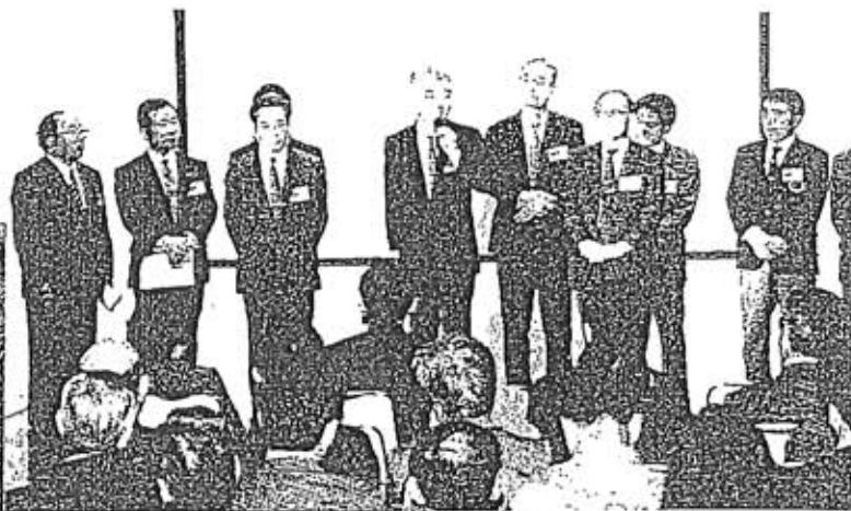
▲設立総会、壇上に並ぶ関係者

「鉄道ルネッサンス」とやらで鉄道が交通輸送の有効手段として見直され、次々に新しい車両が生まれ、若い女性の間でも話題になっていくという。また一方では、鉄道近代化の波の中で消えていったSLの復活運転も華やかにマスコミをにぎわしており、これに伴い歴史的な車両・施設・構造物への関心が高まりつつある。まさに、「鉄道復権」の動きがさまざまなかたちで輝き始めている。