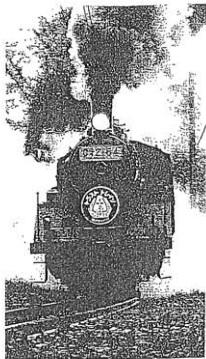
▲Tトレイン (同 渡辺一男氏)